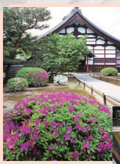
鷲峰山(じゅうぶざん) 高台寺(臨濟宗建仁寺派) 庫裡