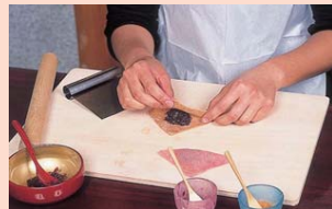
生八つ橋手作り体験