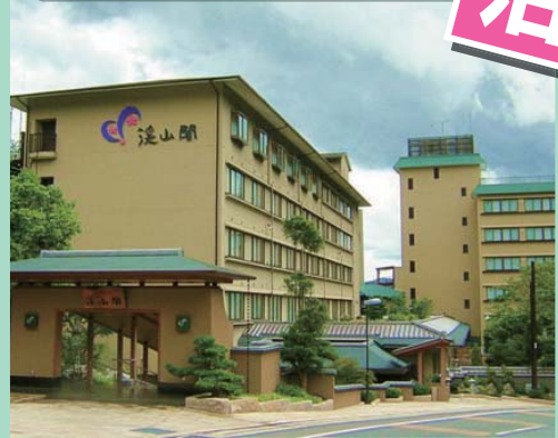
京の雅をお楽しみください