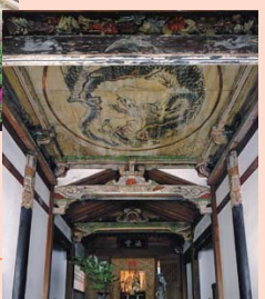
開山堂 重要文化財