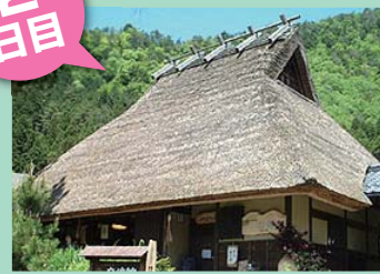
かやぶきの里 日常を忘れて ゆったりと お過ごし下さい