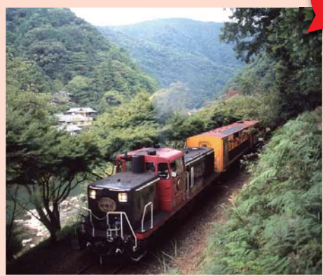
ノスタルジックなそのデザインが、訪れる人々の夢とロマンを誘う観光列車。